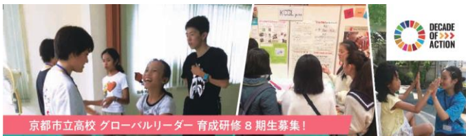
京都市立高校 グローバルリーダー 育成研修 8 期生募集!