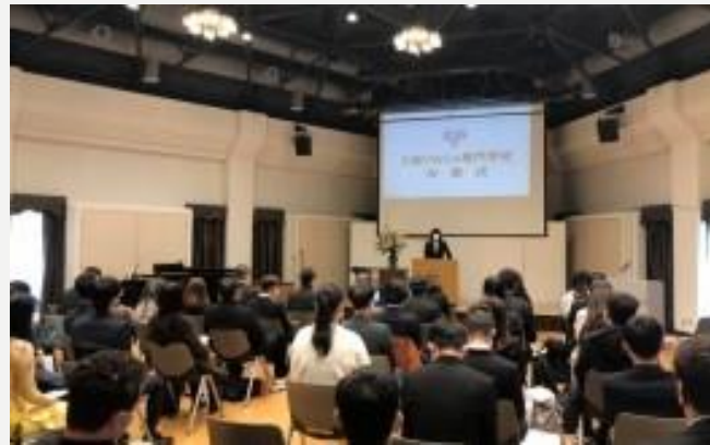
大阪YWCA専門学校 留学生卒業式