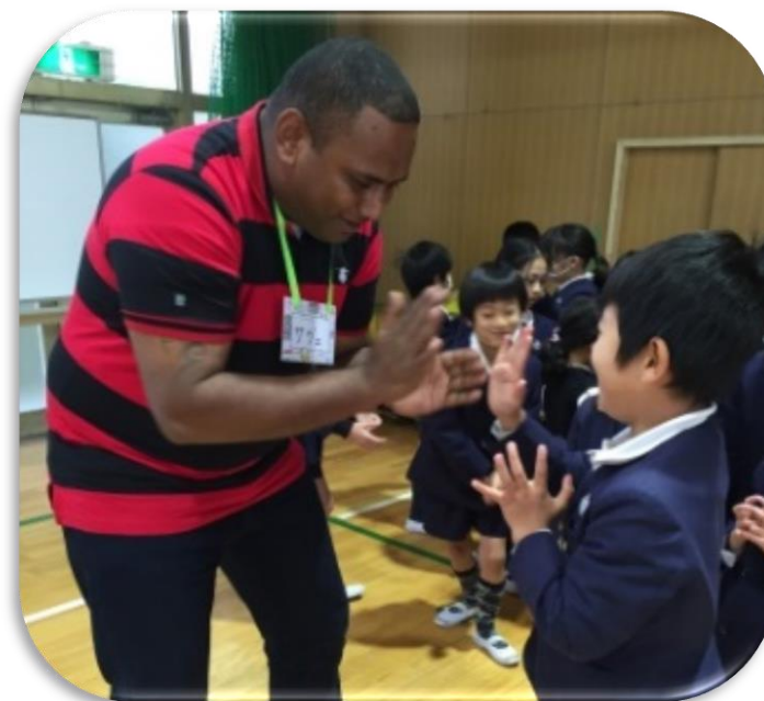
技術研修員との交流