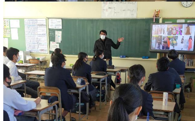
人権教育(多文化共生)「外国人になるという事」(中3)