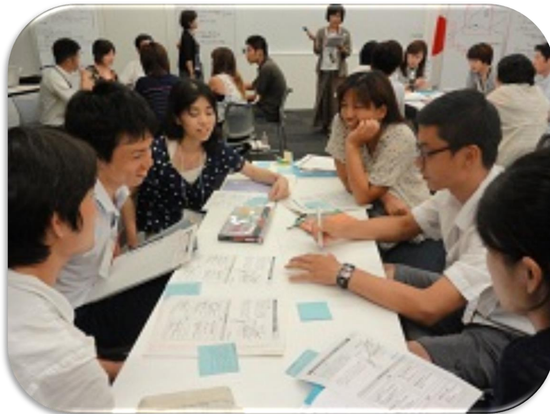
開発教育指導者研修