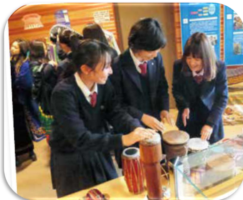
JICA関西センター訪問