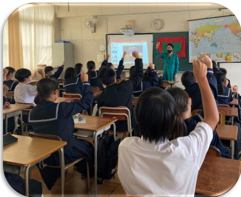
国際協力出前講座